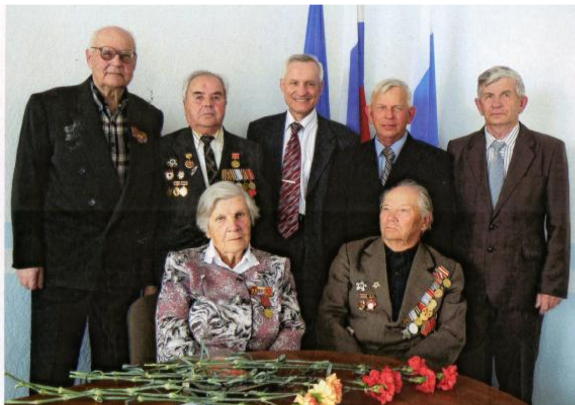
Городской совет ветеранов