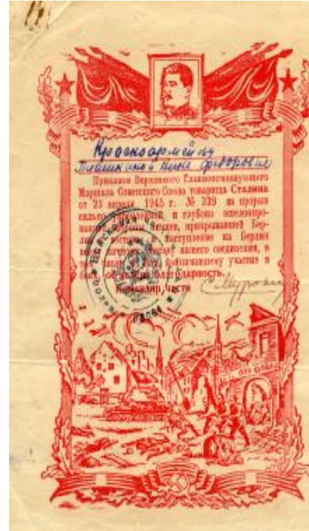
Благодарственные грамоты от Верховного Главнокомандующего Маршала Советского Союза товарища Сталина.