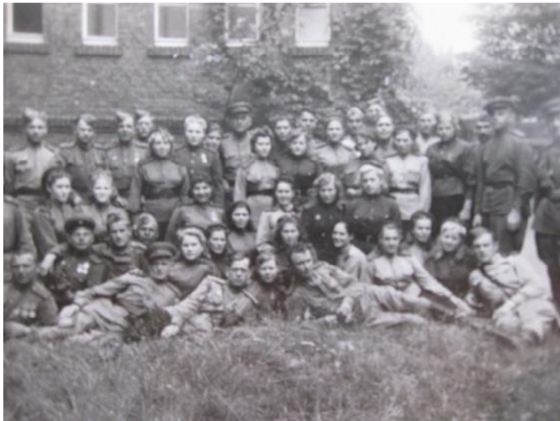
Первое хирургическое отделение ПХГ №5141