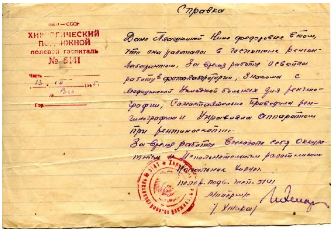
Справка о работе рентген – лаборантом в госпитале