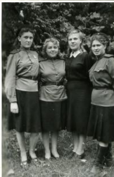
Девушки первого хирургического отделения Германия 1945 год